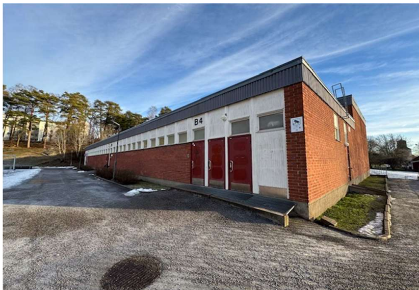
Fotot visar Kämpingeskolans skolgymnastikbyggnad.